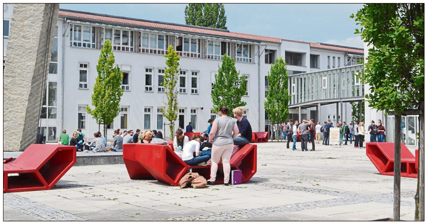
125 Sitzplätze in der Mensa stehen 5000 Studierende gegenüber. Das soll sich bald ändern. Der Haushaltsausschuss im Landtag hat die Kosten für eine neue Mensa an der Hochschule Landshut bewilligt.